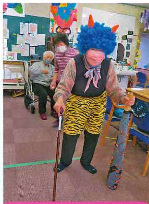
鬼に扮するご利用者