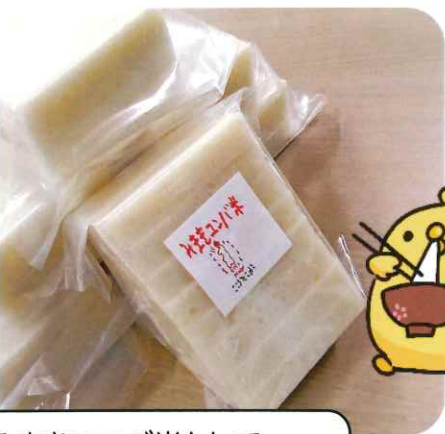
きたみまきユニバ米として販売しました。

その後、ついたお餅はあんこときなこのたっぷりついたお餅となり、皆さんおいしそう食べていました。