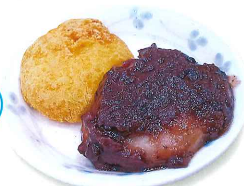
きなこあんこのおもち♡