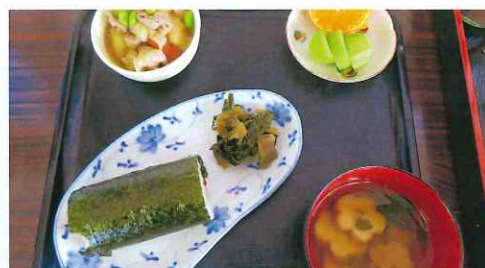
節分と言ったら やっぱり恵方巻は外せないですね