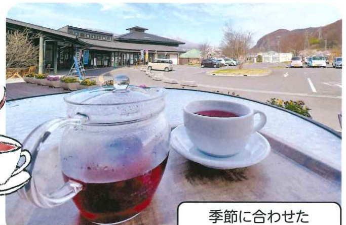
季節に合わせたハーブティーもご用意しています。