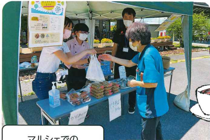
マルシェでの出店の様子

これからも、地域・社会にご愛顧いただける場所で在るよう、よりよいお店づくりに励んでいきますので、ご支援ご指導くださいますようお願い申し上げます。