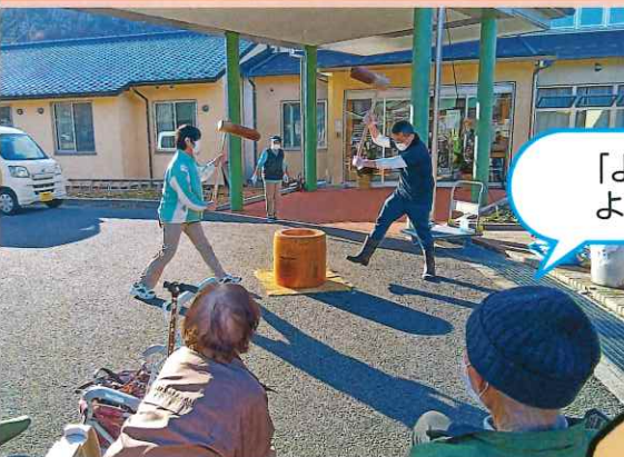
「よいしょー！ よいしょー！」