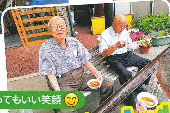
とってもいい笑顔 😊