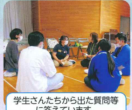
学生さんたちから出た質問等 に答えています。