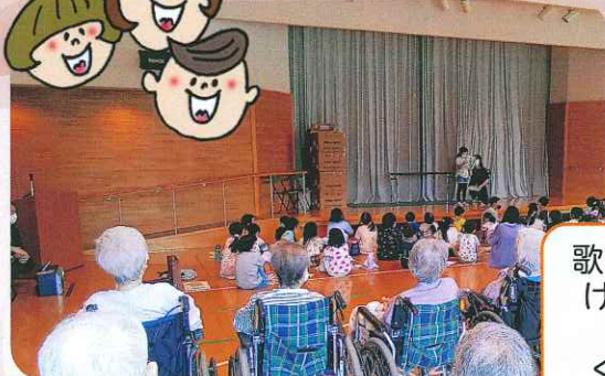
歌になわとび、 けん玉などを 披露してくれました。