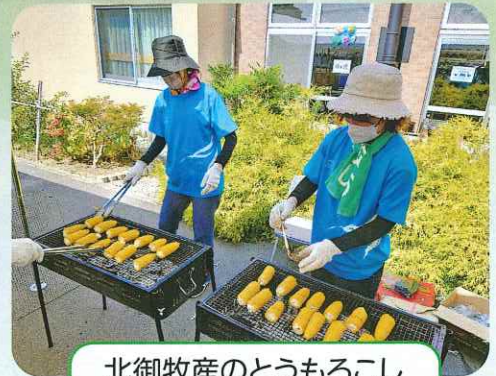
北御牧産のとうもろこし