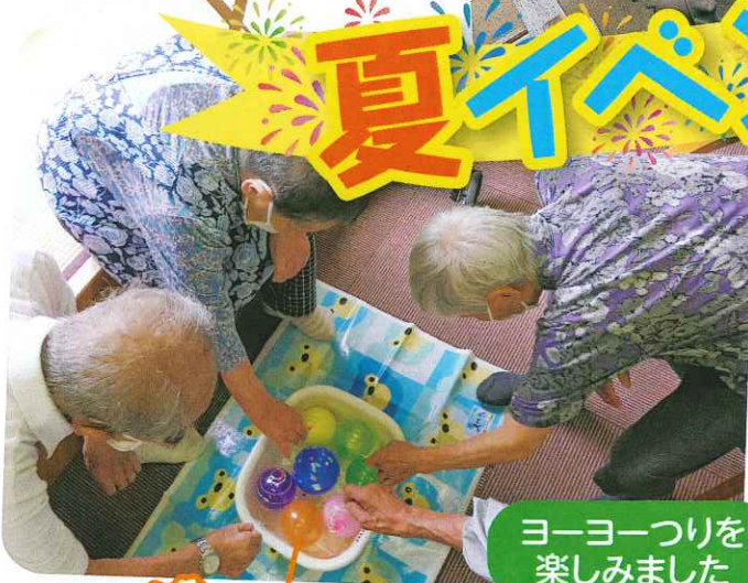
ヨーヨーつりを 楽しみました