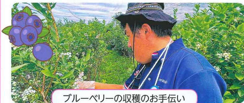
ブルーベリーの収穫のお手伝い

就労継続支援B型のスタッフさんによる農作業で収穫した野菜を法人内やアクティブセンターなどで販売しています。今年は、昨年よりも野菜の種類をたくさん増やしました。暑い中の作業は大変な部分もありますが、大きな野菜を収穫できた時など良い顔をして帰ってくるスタッフさんを見ると、やりがいのある仕事になっているように感じます。今や農作業は、スタッフさんの人気業務のひとつになっています。