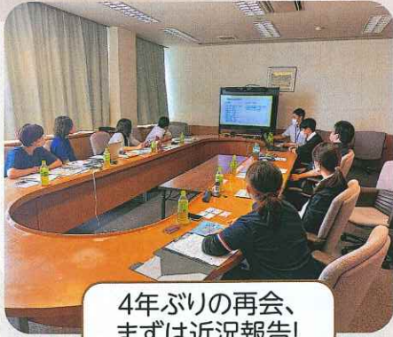
4年ぶりの再会、 まずは近況報告!