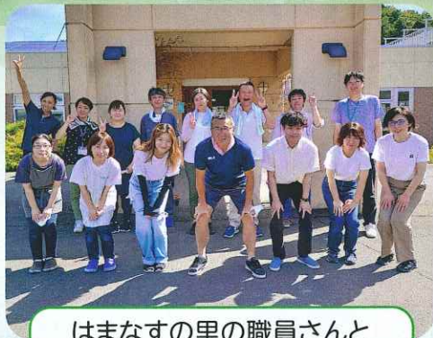
はまなすの里の職員さんと