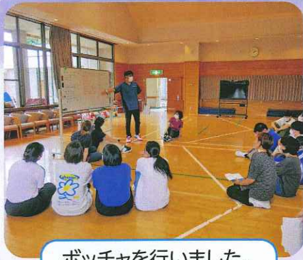
ポッチャを行いました。