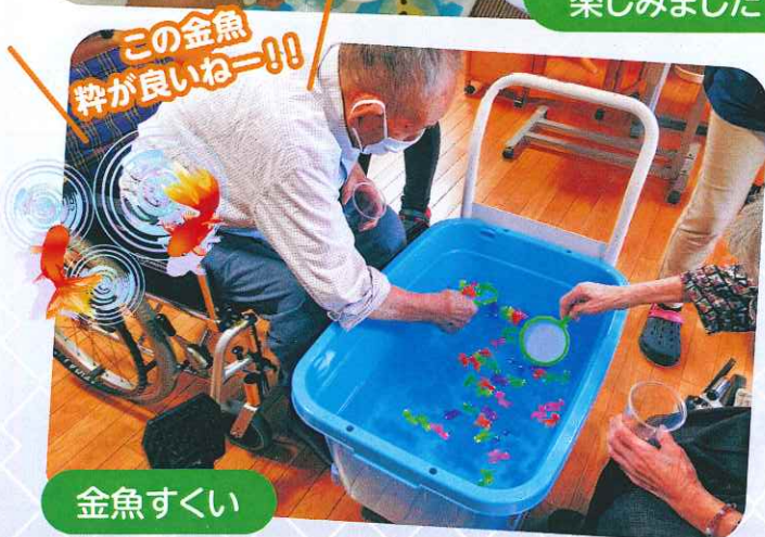
この金魚 粋が良いねー!! 金魚すくい