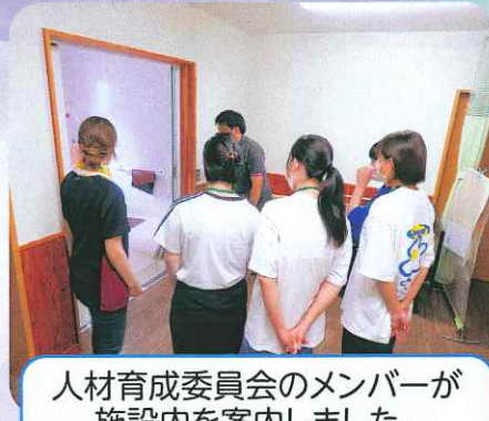
人材育成委員会のメンバーが 施設内を案内しました。