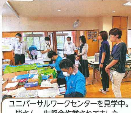
ユニバーサルワークセンターを見学中。 皆さん一生懸命作業されてました。