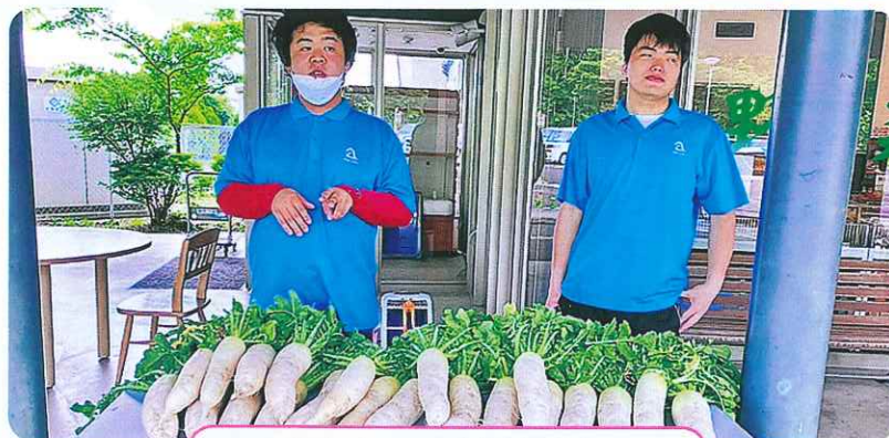
取れたての大根を販売