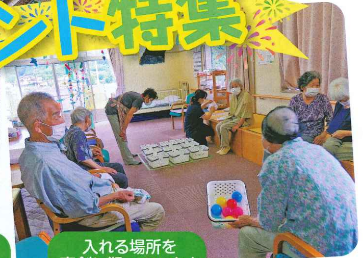
入れる場所を 真剣に狙っています