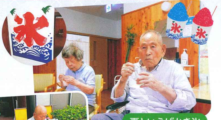
夏といえばかき氷