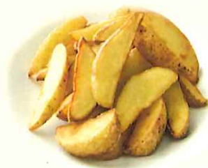
ポテトフライ 300 yen