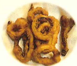
いか揚げ 500 yen