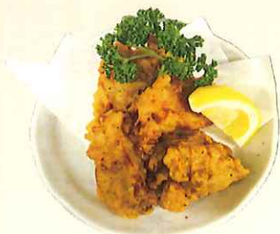
鶏のから揚げ 500 yen